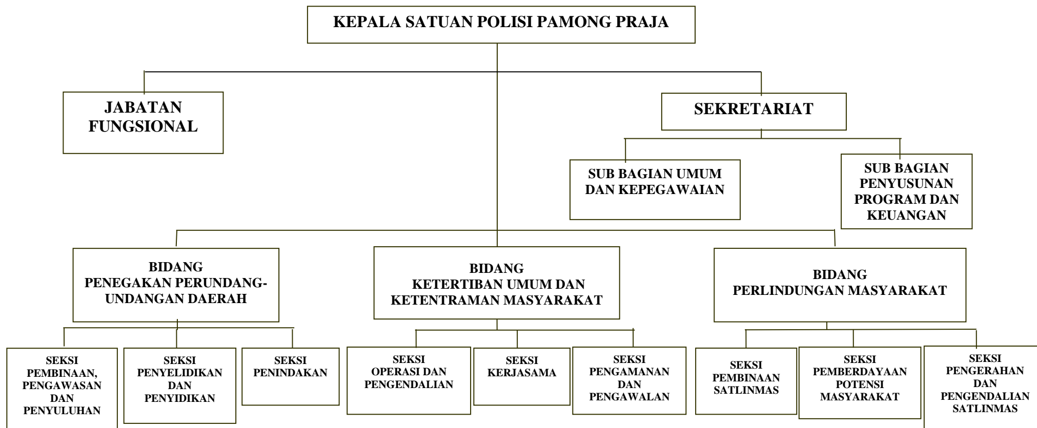
GAMBAR II.1 BAGAN STRUKTUR ORGANISASI SATUAN POLISI PAMONG PRAJA KABUPATEN MOJOKERTO